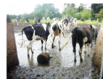
Optrådt og smattet areal, som kvierne skal igennem, når de skal ud. Her kan optimeres ved at etablere en ordentlig drivvej.

Ofte forekommer ændringerne meget små, men den tidsmæssige betydning i det daglige er meget stor. Hvilket gør det meget oplagt at komme i gang med det samme.