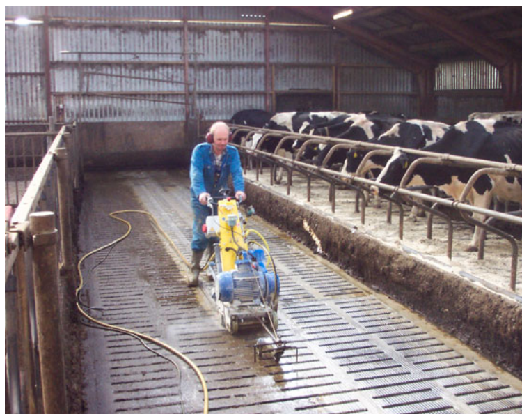
Rilleskæring er en forbedring: Glatte gulve bliver skridsikre.

Fokus er flyttet fra overvejelser om nye staldanlæg til at udnytte det, der allerede er – optimalt. Det kan være optimering på funktion og indretningen af stalden, men også en optimering på de tekniske anlæg kan skabe merværdi. Formålet med denne FarmTest er at vise forskellige optimeringsområder i eksisterende stalde, hvor der er muligheder for forbedring.